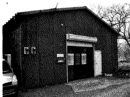
中帰連平和記念館

2 撫順の奇蹟 気高い理性で激しい怒りをおさえよう。復讐よりは恩恵を施すことこそが、有徳の道であろう。——『テンペスト』第五幕第一場 戦後、シベリアに約六〇万人が抑留され六万人が亡くなったといわれていますが、生存者のうちの九六九人が、五年後の一九五〇(昭和二五)年、独立後の中国政府に「戦犯」として引き渡され、六年間「撫順戦犯管理所」に収容されました。彼らの多くは、「三光」 (1) などの加害や虐殺などを行なっており、二〇〇〇(平成一二)年にいわゆる従軍慰安婦問題を裁いた「女性国際戦犯法廷」で加害証言をした二人の元日本兵も撫順戦犯管理所からの帰還者です。 (2) 撫順戦犯管理所には上は中将から下は一般の兵まで収容されました。彼らは、自らの過去を思い、処刑さえ覚悟していました。しかし、管理所では強制労働も強制学習もなく、中国人がコウリャン飯を一日二食しか食べられない状況の中で、彼らは白米を食べ、肉野菜などを十分に与えられ、性病には当時開発されたばかりの、まだ非常に高価で手に入りにくかった「ペニシリン」を連日打ち、治してくれました。 管理所の中には医療施設や床屋などすべて完備され、スティーム暖房さえ通され何の不自由もありませんでした。しかし彼らはこの待遇を処刑前の「最後の晚餐」ではと疑心暗鬼でした。しかし待遇はその後も変わりませんでした。