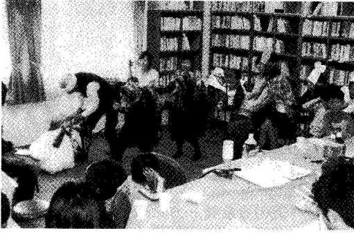
「こどもとしょかん」オープンセレモニー （「友の会」会報から）

この寛大措置は独立したばかりの中国が世界の眼を気にした国策であった、との解釈もあります。しかし国策であれ何であれ、「事実、あった事」なのです。(4)